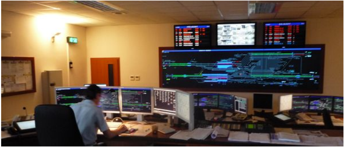
obr.: Ústřední stavědlo Kolín