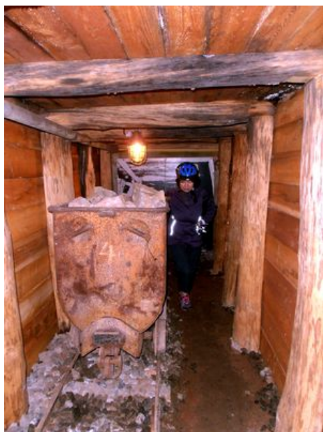
Arzberg - hornické muzeum