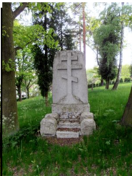
Cheb - vojenský zajatecký hřbitov z I. světové války

Odpoledne se trochu vyčáslilo, takže jsme hupli na kola a podél Ohře jsme dojeli k zámku Mostov a někteří z nás až do Kynšperku nad Ohří, známého nejen zajímavým mostem, ale i pivovarem.