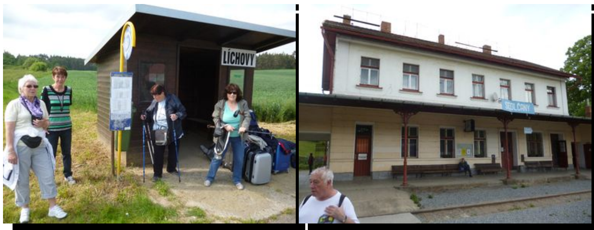
text a fotografie Vlasta Šulcová