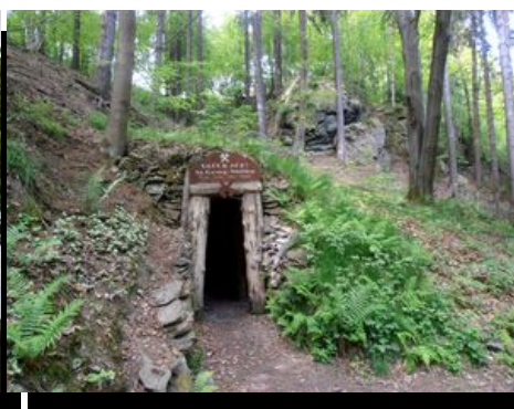
Schlottenhof - důl