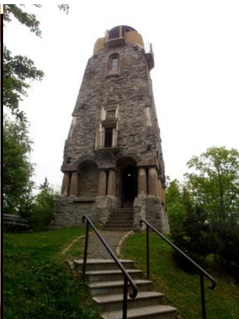
Cheb - Bismarckova rozhledna