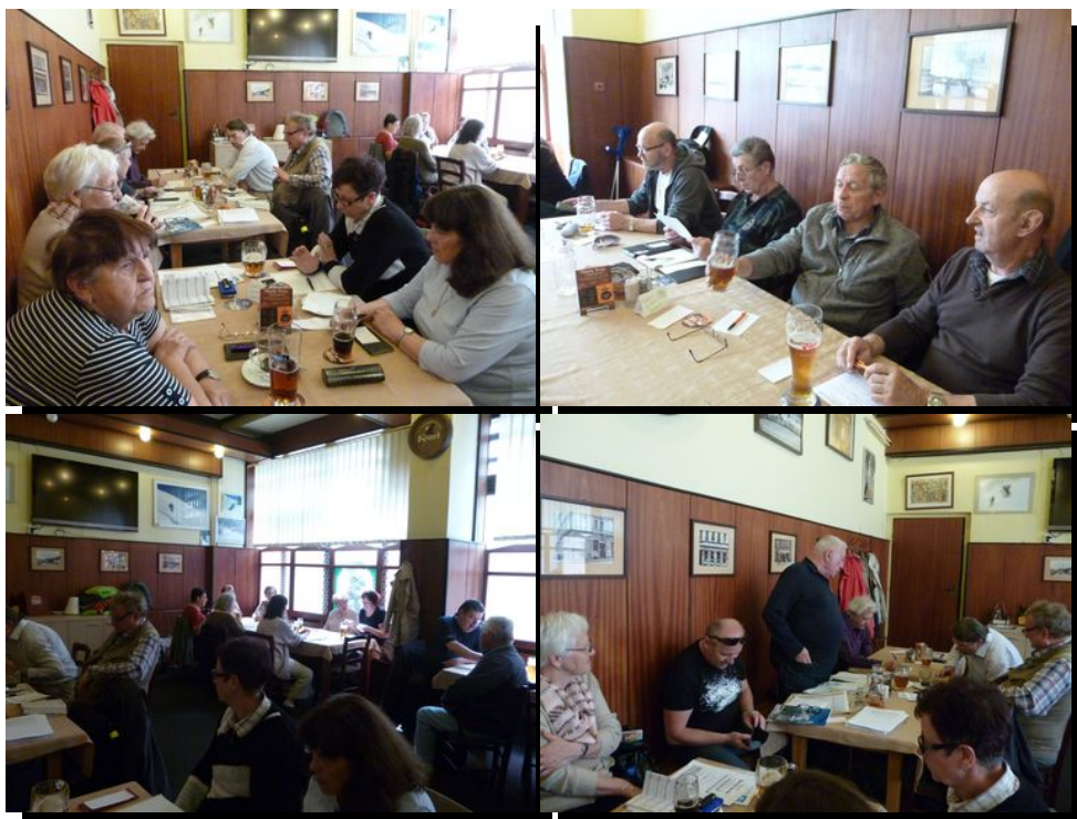
zapsala + foto Šulcová Vlasta

Rovněž mezi nás zavítal pan Láďa Kácovský a pan Petr Skrečka, vysvětlili nám nějaké podrobnosti k prolongaci režijních průkazek na rok 2018 a seznámili nás s dalšími informacemi o dráze. Po diskusi jsme se rozešli. Příští schůze se koná dne 15.5.2018 opět v uvedené restauraci.