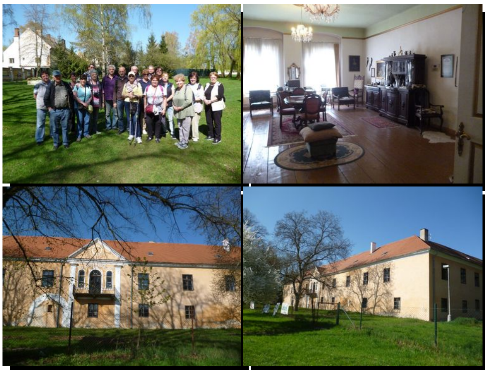
zapsala a foto Šulcová Vlasta