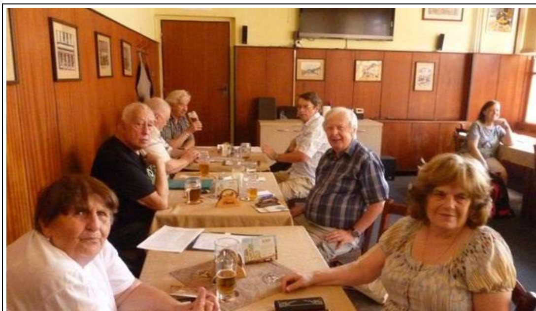
zapsala a fotila Vlasta Šulcová

Poslední červnová schůze se konala dne 18.6.2019 na Žižkově v restauraci "u Kozla". Schůzi zahájil předseda pan Polák, omluvil našeho člena pana Tetivu pro nemoc. Plánovaná akce 25.6.2019 se nekoná a náhradní akci nikdo nevymyslel. Tato schůze byla poslední před prázdninami, tak jsme si všichni popřáli hezké počasí a abychom se ve zdraví zase sešli všichni 17.9.2019 na další naší schůzi, kde si upřesníme výlet do Jaroměře. Ještě chvíli jsme diskutovali a poté jsme se rozešli.